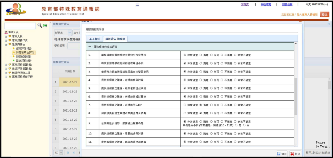
表件5-3.服務績效評估