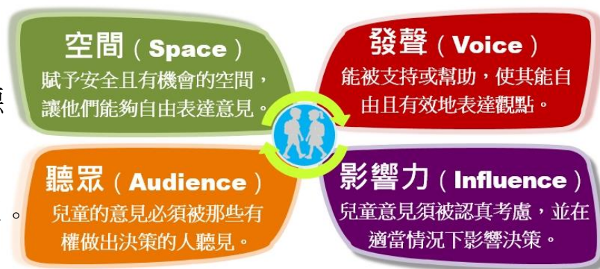
Lundy's model of participation